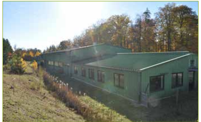
Weitere Lagerhallen mit Bürogebäude und Stellflächen