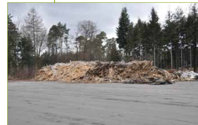
Schwerlast-Parkplatz zur Lagerung verschiedener Güter