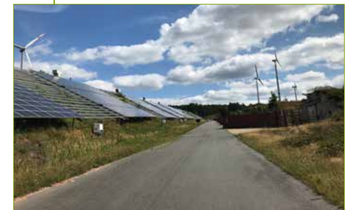
2,3 MW PV-Anlage auf einer verfüllten Bunkerreihe