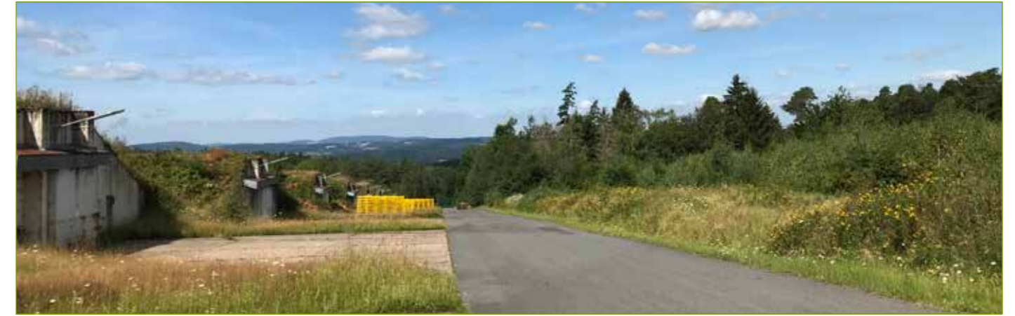
Teilansicht des südlichen-westlichen Areals