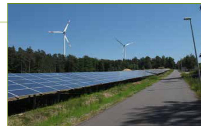
5 MW PV-Anlage an der Solarallee