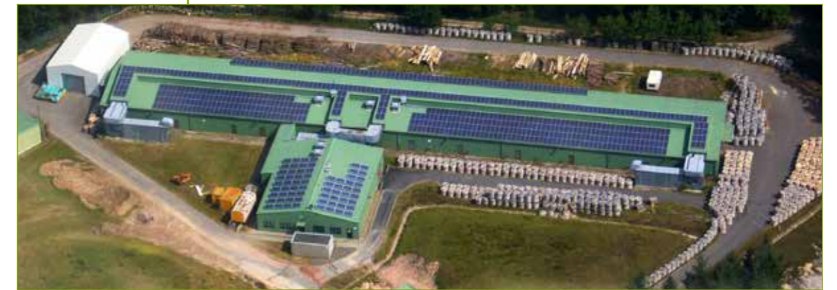
Ehemalige Munitionsaufbereitungsanlage mit Bürogebäude und Konferenzraum