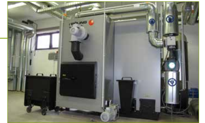
Holzhackschnitzel-Anlage zur Nahwärmeversorgung