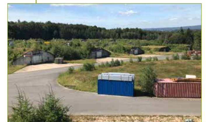
Teilansicht der 120 Lagerbunker