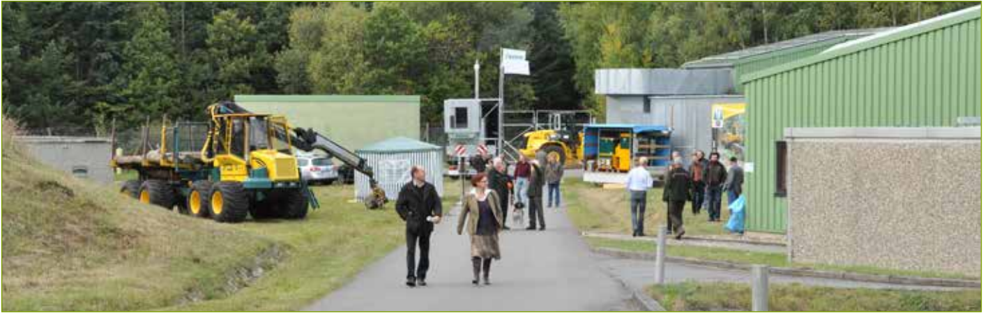
Fläche für Firmen-Events, Ausstellungen und kleinen Messen