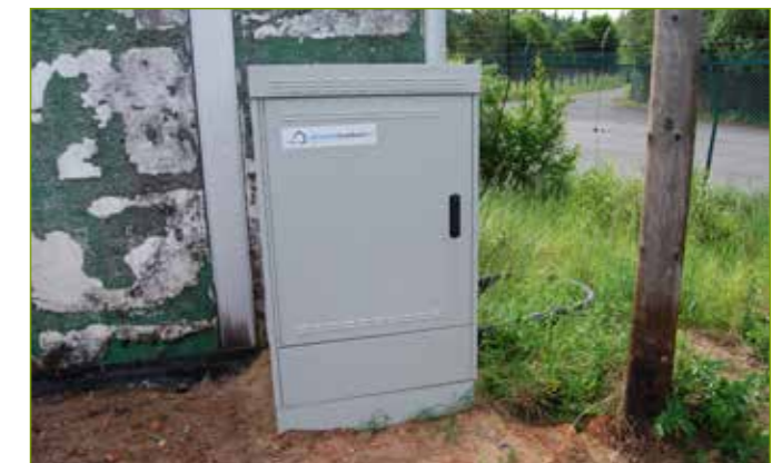
Glasfaser-Anschluss mit 50 MBit/s, erweiterbar